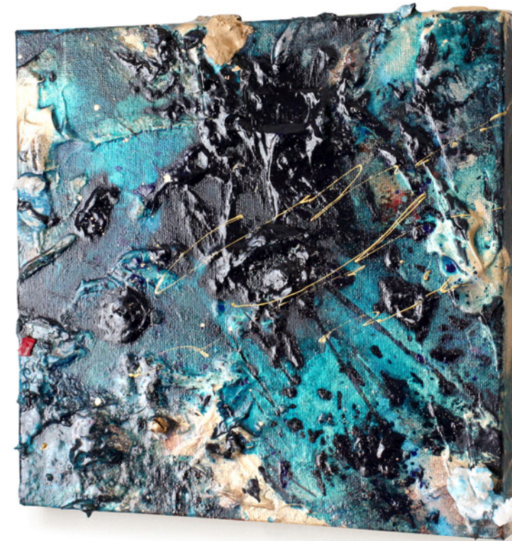
Daybreak/blue 2024 25.0×25.0cm