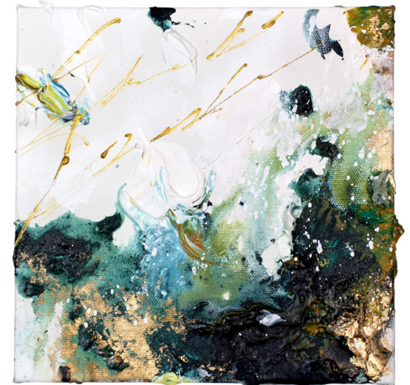
letter Green あなたへ、私へ letter Green 2024 20.0×20.0cm

Hoping that the existence of my work will connect to your existence.